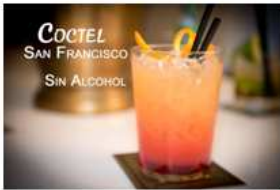
Y San Francisco con alcohol también disponible