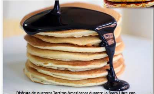
Disfruta de nuestras Tortitas Americanas durante la Barra Libre con 3 tipos de Sirope (Chocolate, Fresa y Arce)