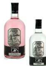
GINEBRA PUERTO DE INDIAS