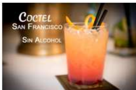
Y San Francisco con alcohol también disponible