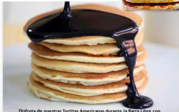
Disfruta de nuestras Tortitas Americanas durante la Barra Libre con 3 tipos de Sirope (Chocolate, Fresa y Arce)